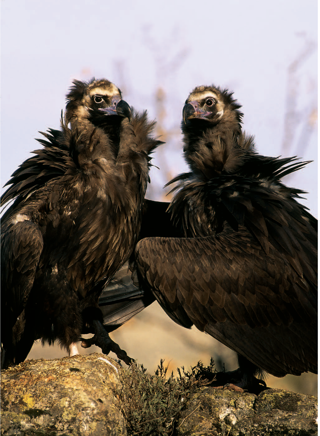
Buitres Negros ( Aegypius monachus ).